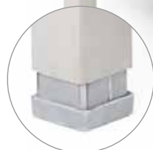
JUSTERBAR FOT Stabiliserar CL60 när golvet är ojämnt.